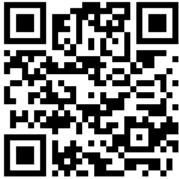
Сайт «Все о первой помощи»

сайте Минздрава России по ссылке https://minzdrav.gov.ru/documents/7188-algoritmy-pervoy-pomosch , доступ к которым возможен с основной страницы сайта через вкладку «Первая помощь».