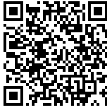
Сайт Минздрава России

Учитывая важность унификации первой помощи и использования для обучения современных учебно-методических материалов, письмом Министра здравоохранения Российской Федерации высшим исполнительным органам государственной власти субъектов Российской Федерации от 19 октября 2022 г. № 16-1/И/2-17651 было рекомендовано использовать разработанный УМК для обучения первой помощи.